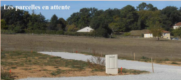
Les parcelles en attente

Le lotissement est lui aussi terminé. Les réseaux sont branchés et les permis en passe d'être acceptés. La commune a profité de cet aménagement pour installer une borne incendie qui permettrait aux pompiers d'intervenir dans le secteur dans de bonnes conditions ; en espérant bien sûr qu'ils n'aient jamais besoin de s'en servir !